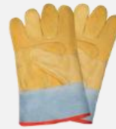
Guantes de seguridad