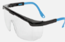
Gafas de seguridad